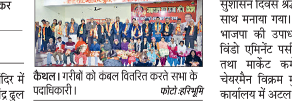
कैथल। गरीबों को कंबल वितरित करते सभा के पदाधिकारी।